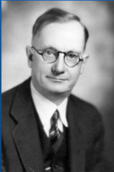
E. S. Bogardus ( 1882 – 1973 )